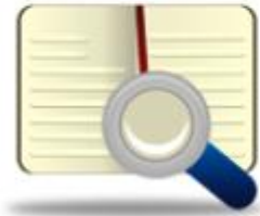
Kütüphane Veritabanları Toplu Tarama