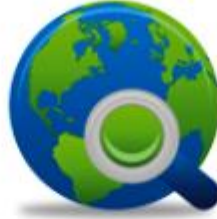
Bilgi Yönetim Sistemleri