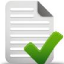
EYS Evrak Yönetim Sistemi