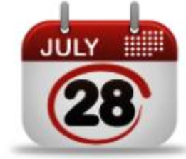
Ders Programı Otomasyonu